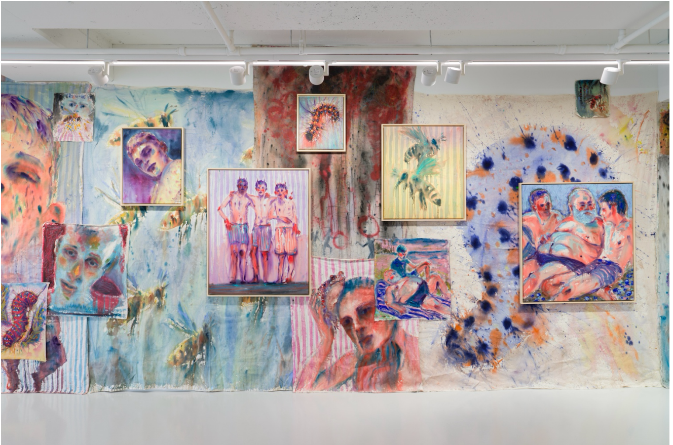
전시 전경, 《두 여름의 폭풍 사이 지역 철학자》, 2025