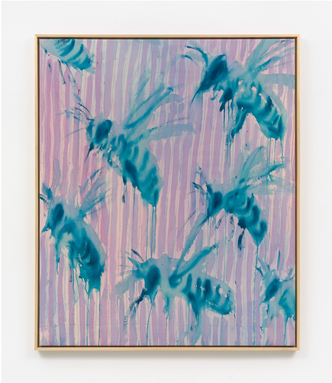
Old inherited bedsheets and 7 bees, 2025