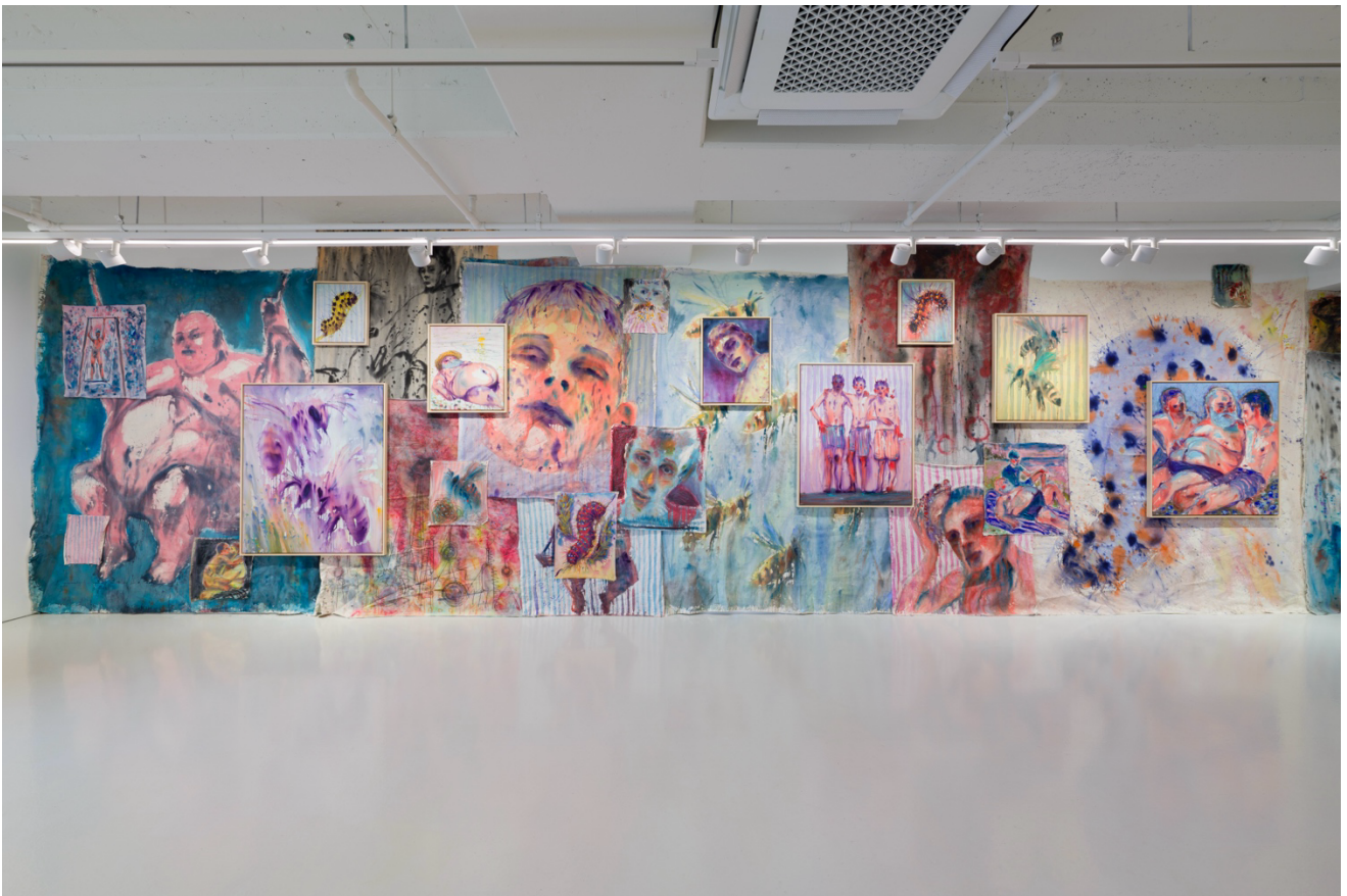
전시 전경, 《두 여름의 폭풍 사이 지역 철학자》, 2025