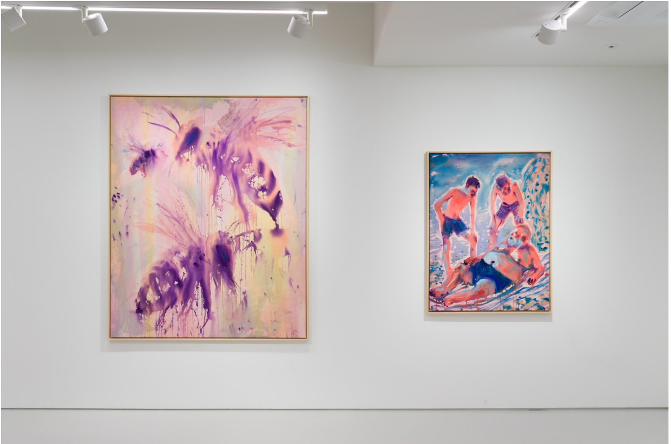
전시 전경, 《두 여름의 폭풍 사이 지역 철학자》, 2025