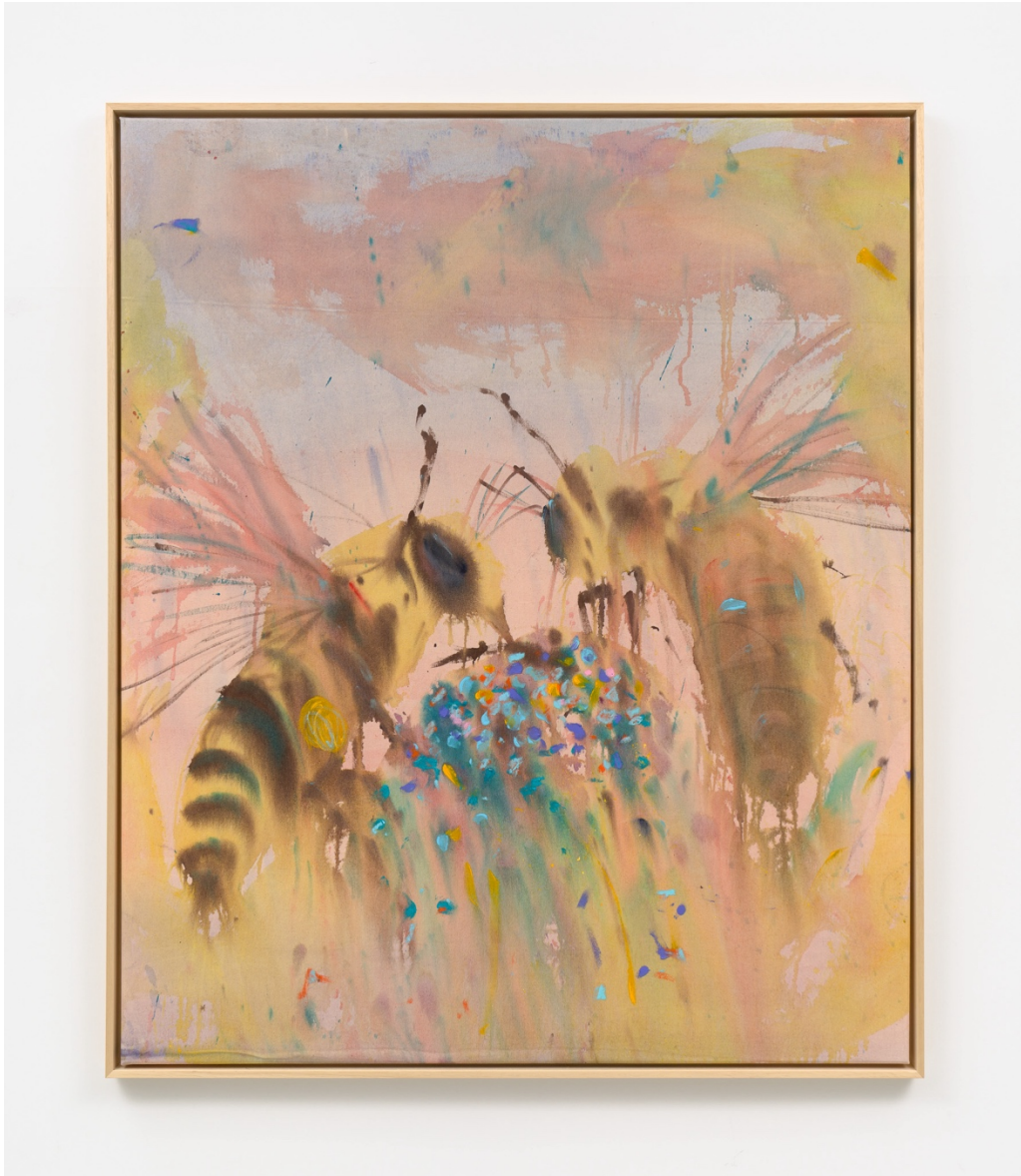
Blue pollen and two bees learning the power of high five, 2025