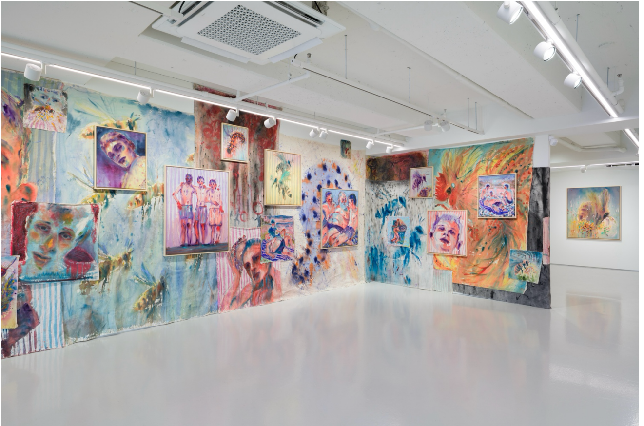
전시 전경, 《두 여름의 폭풍 사이 지역 철학자》, 2025